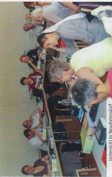
Unterricht in Neudietendorf

Anmeldeschluss für Kurs 32 ist der 30. Juni 2022.