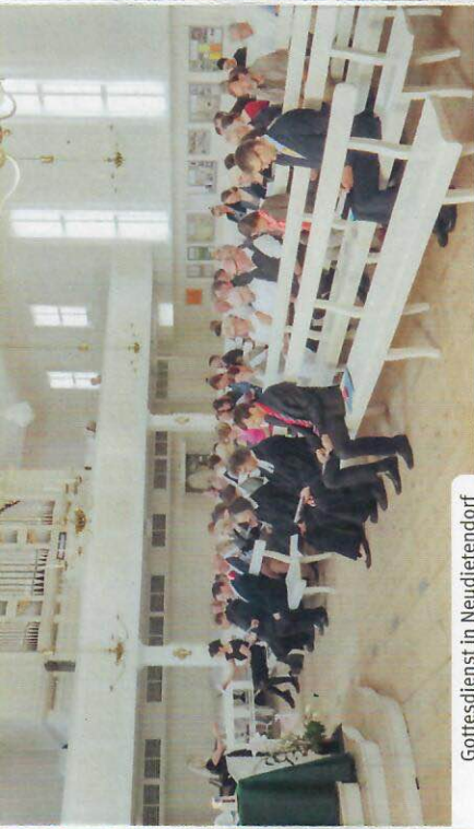
Gottesdienst in Neudietendorf