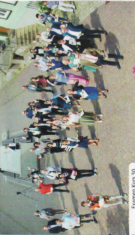
Examen Kurs 30